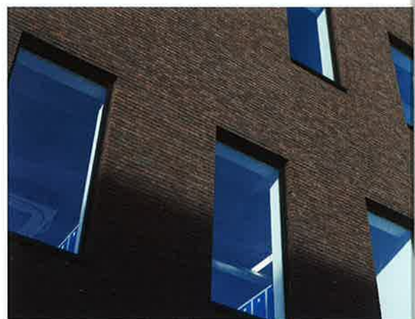
De achterkant van het gebouw ligt vlakbij de oude rijkswachtkazerne.

moest de werken dus heel snel uitvoeren." De Kruidvatwinkel bleef ondertussen open. Tegelijkertijd de bovenliggende winkel renoveren was voor Bontinck en Democo een huzarenstukje. Yavas: "Sommige werken konden niet plaatsvinden tijdens de openingsuren. Afbraakwerken bijvoorbeeld, moesten voor 10 uur plaatsvinden of pas na de sluiting van de winkel." Jamin vertelt hoe dat in z'n werk ging: "In de eerste fase maakten we het oorspronkelijke gelijkvloers van Go Sport klaar voor het Kruidvat. Op hetzelfde moment bereidden we rondom en boven de bestaande winkel de werken voor de Inno voor, zowel voor nieuwbouw als voor renovatie. Na de verhuis van het Kruidvat, rond februari 2014, braken we de parking af en startte het nieuwbouwgedeelte. Tussen april en juni hebben we de ruwbouw dan wind- en waterdicht gemaakt, om ze in het bouwverlof over te kunnen dragen aan de afwerkers van Inno." >