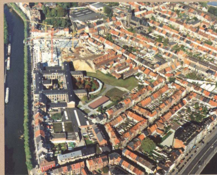
Luchtfoto Heirnis.