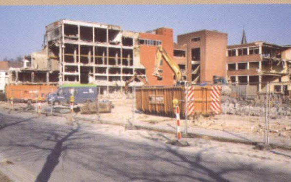
Slopingswerken drukkerij 'Het Volk'. (2003-2004)