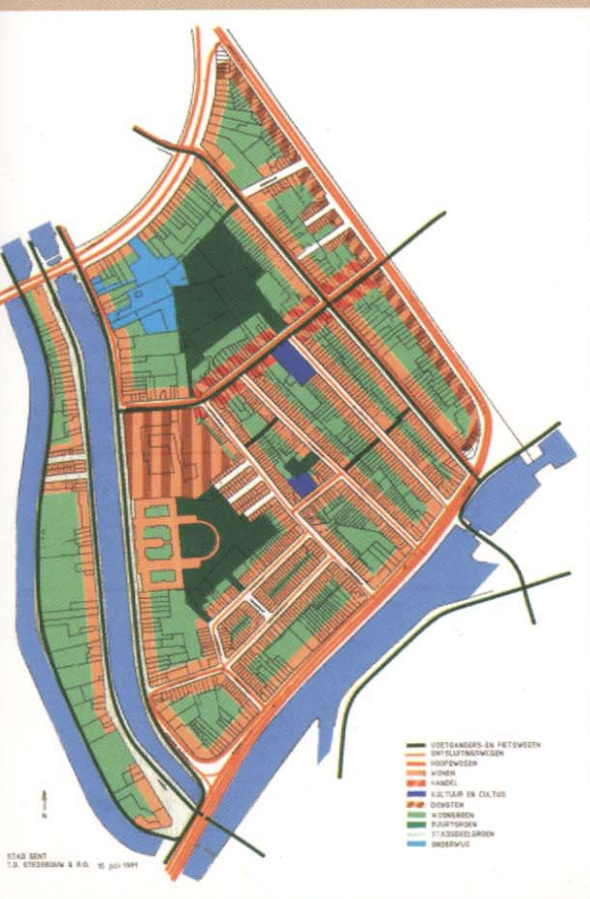
Vorstudie Lousbergspark. (2004)

Voor de wijk Heirnis werd een stadsvernieuwingsproject uitgewerkt, dat o.a. voorzag in meer groen binnen een paar grote woonblokken. Het voormalige Lousberggesticht werd omgebouwd tot een complex van kwaliteitsvolle wooneenheden. De vroegere drukkerij 'Het Volk' werd gesloopt en vervangen door woningen. Een deel van het terrein van 'Het Volk' wordt samengevoegd met de tuin van het Lousberggesticht voor de aanleg van een buurtpark.